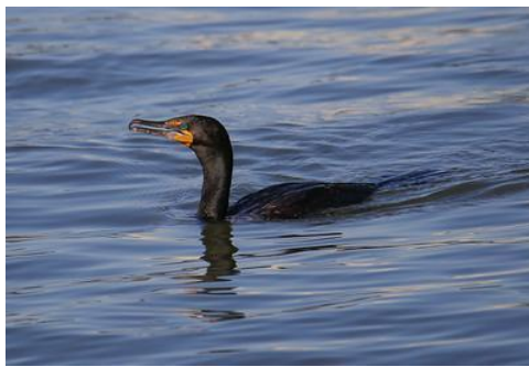
A- Cormorán de doble cresta

El Hudson River Park proporciona un hábitat a más de 100 especies de aves. Abajo puedes encontrar algunas fotos de pájaros que puedes encontrar en el parque, capturadas por nuestro maravilloso naturalista del parque, Keith Michael.