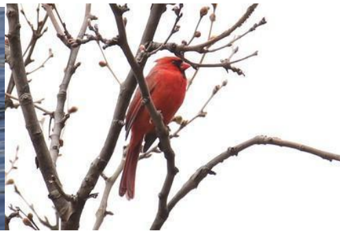
B- Cardenal norteamericano