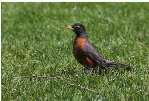
E- Petirrojo americano