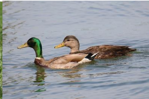
F- Patos reales