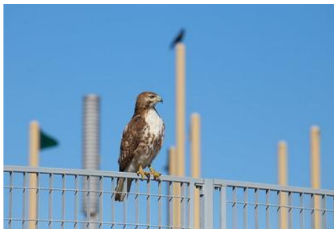
C- Halcón de cola roja