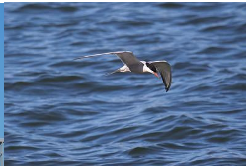
D- Charrán común