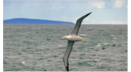
Northern royal albatross