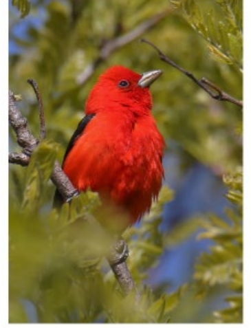
Scarlet tanager

একটি রকিং বার্ড ক্র্যাফট কেমন হতে পারে তার একটি উদাহরণ এখানে।